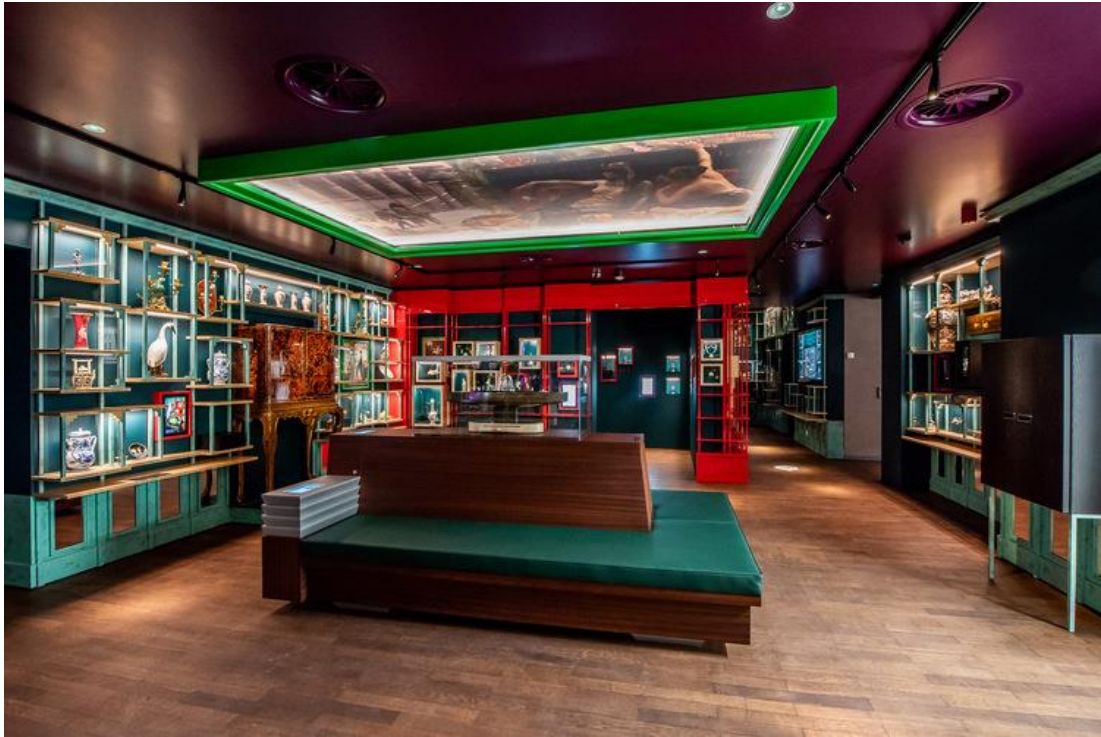
Photo : La chambre des merveilles de DIVA (conçue par Gert Voorjans) © DIVA / Gert Voorjans