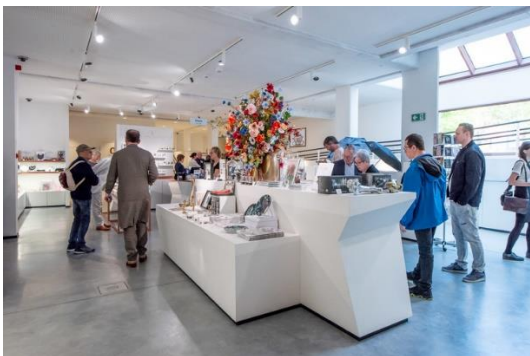
Photo : La boutique Silvius Druon

Dans la boutique du premier étage, vous découvrirez de somptueux bijoux, diamants et montres de Silvius Druon et d'autres marques belges. Plus d'infos sur www.silviusdruon.com