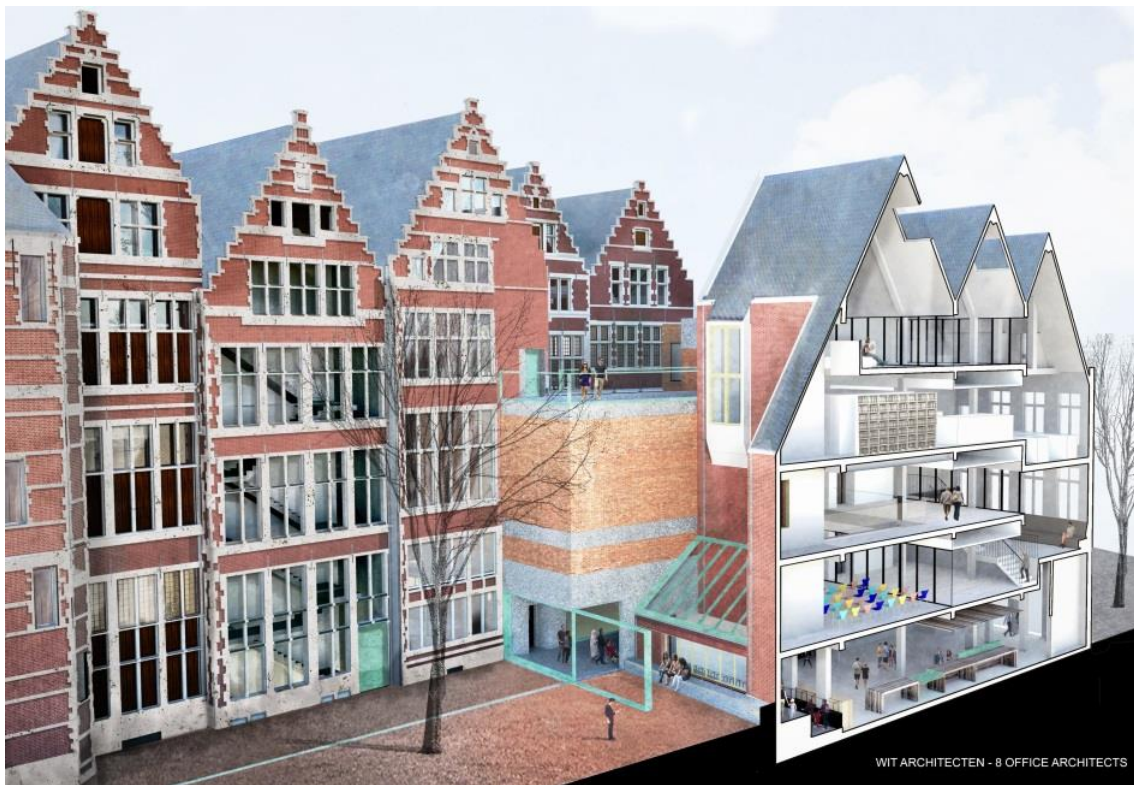
Photo : coupe façade latérale du musée © DIVA / TV WIT architecten – 8 office architects