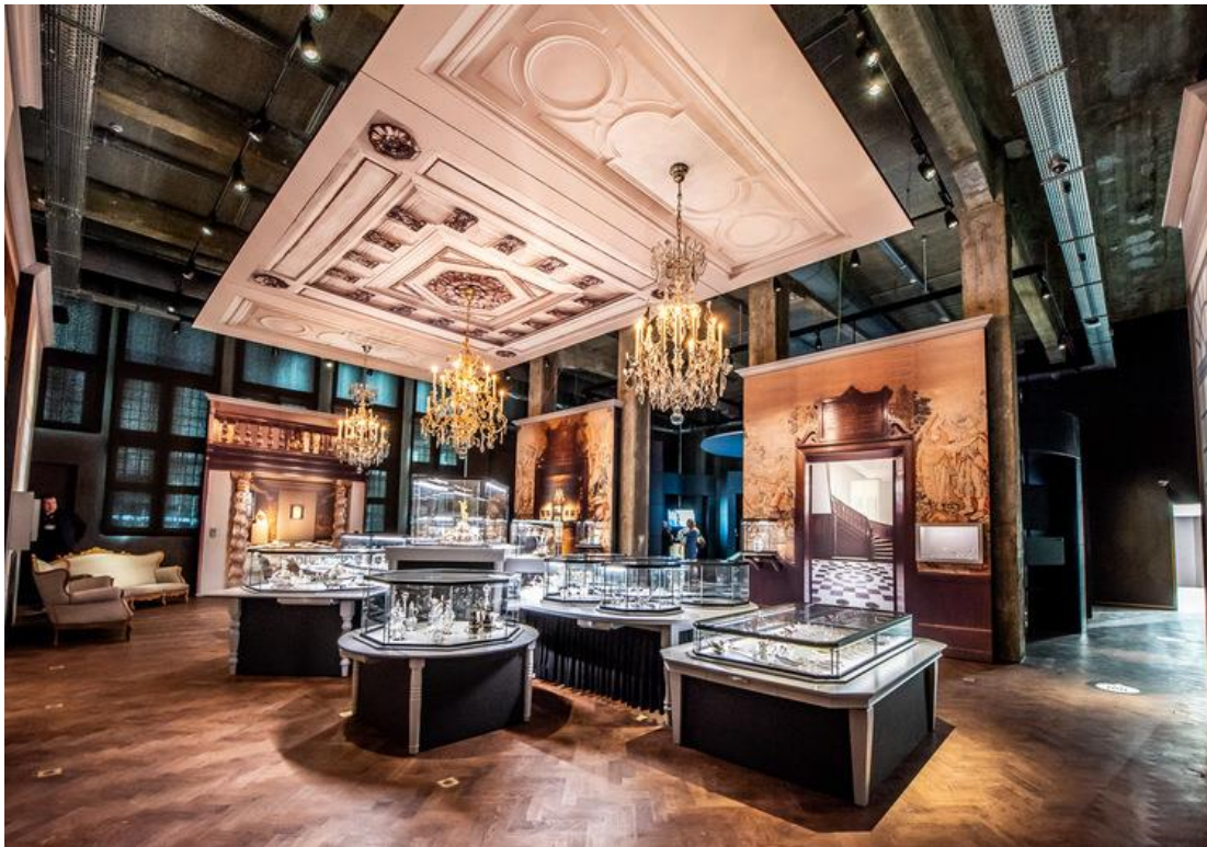
Photo : La salle à manger de Diva (aménagée par Carla Janssen Höfelt)